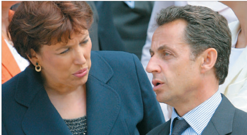
Roselyne Bachelot et Nicolas Sarkozy dans la tourmente

Un tiers seulement des médecins libéraux et des praticiens hospitaliers voteraient pour l'UMP et ses alliés au premier tour des élections régionales du 14 mars, selon un sondage réalisé par l'IFOP pour « le Quotidien ». Plus grave pour le gouvernement : 73 % des médecins sanctionnent la politique de Nicolas Sarkozy en matière de santé et de protection sociale et 76 % d'entre eux (82 % des médecins de ville) ne font plus confiance à la ministre de la santé.